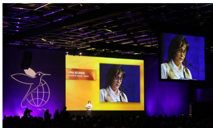
Présentation pendant le 20 ème Congrès International du Diabète

YP : « L'objectif principal, pour l'énorme système A/V utilisé lors de cette convention, était que tous les participants puissent entendre, via les haut-parleurs, de façon claire et nette. Pour ce faire, nous avons utilisé 3 grands écrans de 5.5mx9.7m pour la scène, 4 écrans de 3.2mx4.2m, ainsi 6 écrans de 2.7mx3.6m pour le reste de la salle. Les trois écrans principaux devaient être alimentés en HD 1080p, donc tout le show devait être en 1080p également. Le client avait aussi demandé de pouvoir diffuser en direct 2 PIP (Picture in Picture) sur un fond live. »